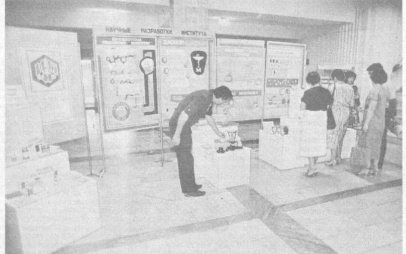
ТАШКЕНТ. Выставка, посвященная развитию химической науки в Узбекистане, открылась в рамках проходящего 14-го Менделеевского съезда по общей и прикладной химии.