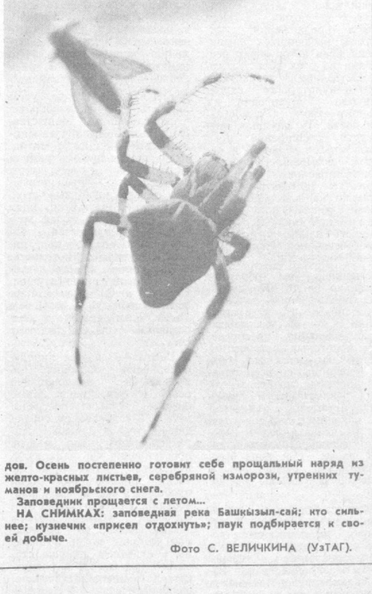
Осень постепенно готовит себе прощальный наряд из желто-красных листьев, серебряной изморози, утренних туманов и ноябрьского снега. Заповедник прощается с летом... НА СНИМКАХ: заповедная река Башкир-сай; кто сильнее: кузнечик «присел отдохнуть»; паук подбирается к своей добыче.

С. ЯКОВЛЕВ. Кандидат филологических наук, член Союза журналистов СССР. Ленинград.