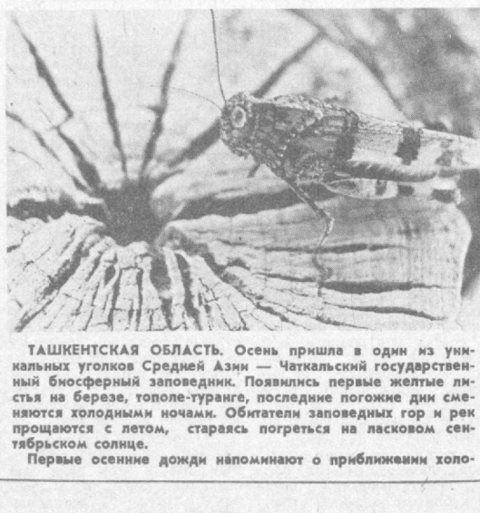
ТАШКЕНТСКАЯ ОБЛАСТЬ. Осень пришла в один из уникальных уголков Средней Азии — Чаткальский государственный биосферный заповедник. Появились первые желтые листья на березе, тополе-туранике, последние пологие дни смешаются холодными ночами. Обитатели заповедных гор и рек прощаются с летом, стараются погреться на ласковом сентябрьском солнце. Первые осенние дожди напоминают о приближении холо-