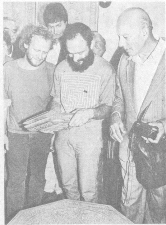
ТАШКЕНТ. Швейцария является одной из семидесяти стран мира, с которыми Узбекистан поддерживает тесные деловые и культурные связи. Ярким подтверждением дружбы, взаимопонимания, сотрудничества стала неделя швейцарской культуры в Узбекской ССР.

Члены ассоциации «Швейцария — СССР» преподнесли в дар Ташкентскому филиалу Центрального музея В. И. Ленина экспозицию «Ленин в Швейцарии». В Доме кино открылся комплекс вернисажа «Панорама Швейцарии».