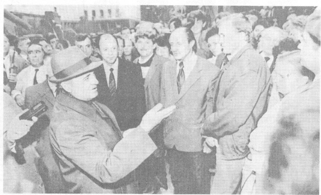
Во время встречи с жителями Киева.