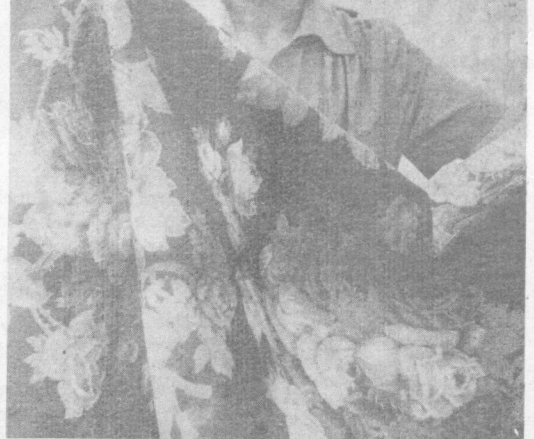
Все больше товаров для народа выпускает Ташкентский текстильный комбинат...

Сборник выпущен Издательством политической литературы.