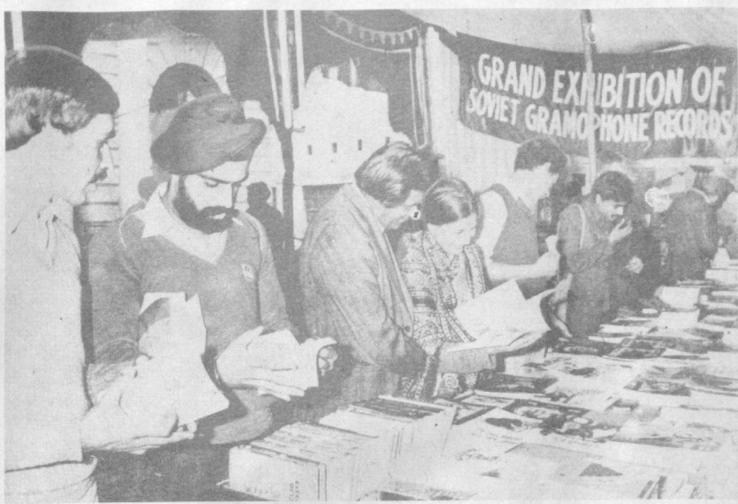
Советские книги пользуются все большей популярностью в Индии. Сейчас страна ежегодно импортирует более миллиона экземпляров книжной продукции. Расширение связей в этой области — хороший пример сотрудничества на благо дружбы, взаимопонимания, мира и прогресса. На снимке: выставка-продажа советской литературы и грамзаписей в Дели.

оперативности. Так, в мае прошлого года мы предложили для ряда предприятий Ленинграда новый оригинальный прибор, позволяющий экономить электроэнергию. Его испытания у заказчиков прошли успешно, и уже в этом году завод начинает поставки новых изделий. Мы побывали в цехах предприятия, где готовилась к отправке в Советский Союз очередная партия электротехнических товаров. Требования к качеству этой продукции, подтвержденные в беседах с рабочими, у нас особые. Техника для предприятий братских стран проходит многократную проверку, все поставки выполняются точно в срок. Большая часть продукции венгерского предприятия экспортируется в СССР.