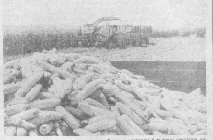
Здесь с площади 4 тысячи гектаров наметено снять 43 тысячи тонн «пштарного зерна». С первых дней лучших показателей в уборочной страде добиваются колхозы имени Абдуллы Набиева, которые обязались убрать весь выращенный на 160 гектарах урожай за 10 рабочих дней. На снимках: механизатор из совхоза имени Абдуллы Набиева Эрин Имомов; идет уборка кукурузы.