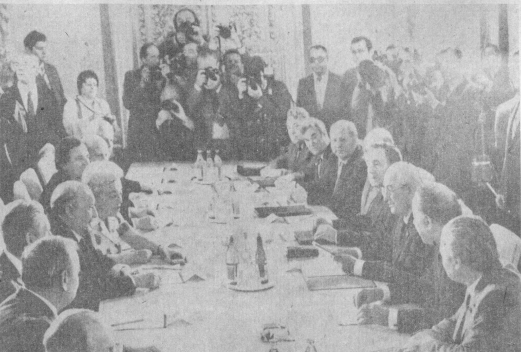
На снимке: во время переговоров.