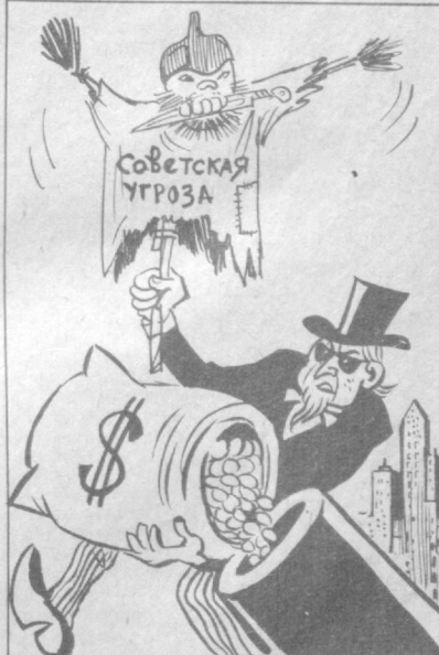
Затасанный лозунг. Рис. А. ХАЛИКОВА.