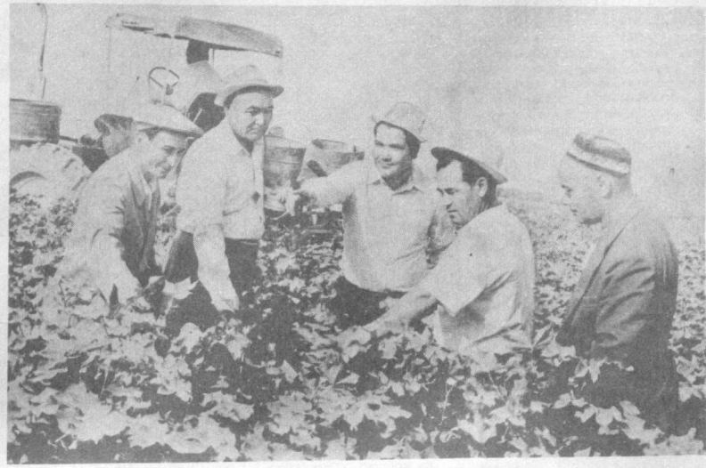
Взаимопроверочная бригада хлопководов Туркмении...