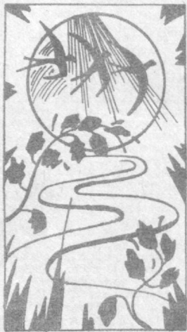
Рис. Т. Подгурский.

Мы в Бахмале, своеобразная «винзавинская дачка» которого — Ойкор — горная вершина, видная в этих местах с любой точки. Ее склоны укрыты густым лесом, увиты тропками, ведущими в дальние кишлаки, соседний Таджикистан.