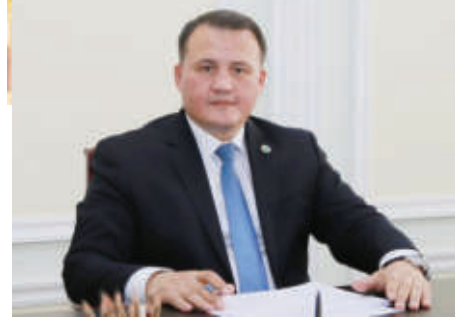
Ақтам ҲАЙТОВ, Олий Мажлис Қонунчилик палатаси Спикери ўринбасари