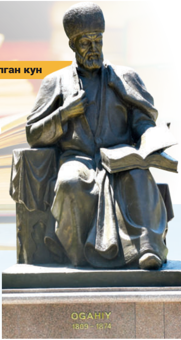
OGAHIY 1869 - 1874

Тарих тақдирлар билан тирик. Тарихимизда илм-фан, маданият ва санъатнинг тамал тошини қўя олган алломалар бор. Ҳавас қилса арзийдиган улуг аждодларимиз бор, ҳавас қилса арзийдиган буюк келажакимиз ҳам албатта бўлади, дея ишонч билдирган, Учинчи Ренессанс даврига дадил қадам ташлашимизга руҳлантирган мухтарам Президентимиз Шавкат Мирзиёев куни кеча Хоразм вилоятига ташрифи пайтида буюк мутафаккир, ер ва эл қадрини билган адиб Огаҳийнинг “илми бўлмаса, касби бўлмаса эртанги куни йўқ” деган фикрларини келтириб ўтдилар. Улуг мутафаккирлар қисматида муайян макон, замон ва касб муҳим ўрин тутлади. Бу фикр забардаст шоир, моҳир таржимон, мироб, тарихчи, олим ва улкан давлат арбоби Муҳаммад Ризо Эрнӣёзбек ўгли Огаҳийга ҳам дахлдор.