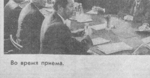
Во время приема.

Ю. В. Андропов особо остановился на вопросе чрезвычайной важности — грозной и реальной опасности распространения гонки вооружений на космос. Напомним у высказывавшейся им уже идея запрещения вообще применения сил как в самом космосе, так и из космоса в отношении земли, но изложил новые крупные инициативы СССР в этой области.