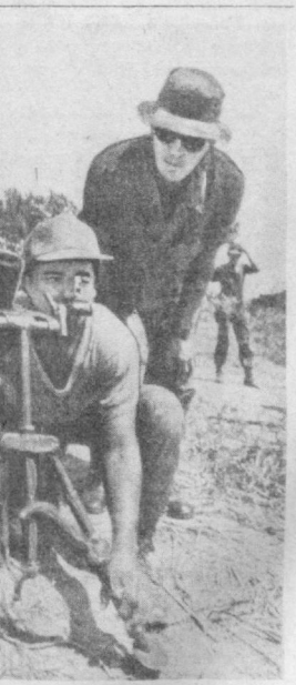
Бурлит Центральная Америка — победоносно завершилась революция в Никарагуа, продолжают борьбу повстанческие силы Сальвадора. Обеспечивая положение в этом регионе, администрация США пытается осуществить планы, направленные на свержение правительства Никарагуа. В соседней Гондурас перерастает в бунт боевая техника, на военных базах обучаются солдаты и офицеры диктатуры. На снимках: справа — партизаны Сальвадора перед выходом на боевое задание, сверху справа — американский советник инструктирует сальвадорского воюка на военной базе США, сверху слева — во время разгрузки американского транспортного самолета в аэропорту гондурасского города Сан-Педро-Сула.

США применяют это оружие в войне против Вьетнама для уничтожения живой силы, поражения особо прочных объектов. Вакуумная бомба использовалась израильскими агрессорами, вторгшимися в Ливан, что привело к многочисленным жертвам среди мирного населения. Создание новых видов во-