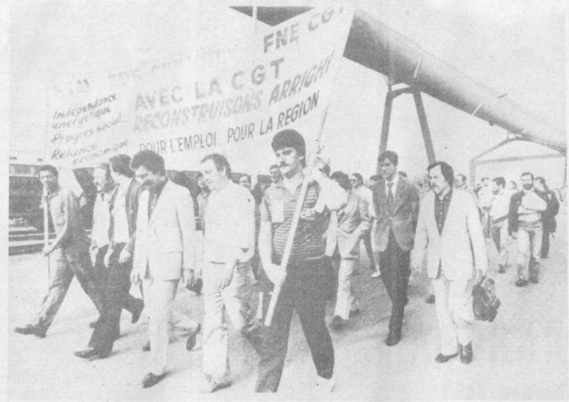
ФРАНЦИЯ. Упорную борьбу против политики свертывания добычи угля и массовых увольнений ведут французские рабочие. Предприниматели под предлогом нерентабельности шахт закрывают их, покупая уголь за рубежом. Сотни горняков, трудящихся других профессий терпят из-за этого работу. Рабочие теплоэлектростанции в парижском пригороде Витри отстояли свое законное и экономическое требование о возобновлении поставок на ТЭЦ французского угля. На снимке из газеты «Юманите»: работники ТЭЦ встречают первый состав с французским углем.