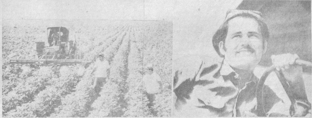
Хлопководы платного отделения динзакского совхоза имени Ичканова, что в Пахтакорском районе, намерены получить в этом году с каждого гектара по 35 центнеров хлопка. И в эти дни механизаторы отделения ведут упорную борьбу за