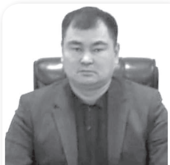
Арманбай БЕКМУРАТОВ, Нукус шаҳри ҳоқими ўринбосари, Маҳалла ва оилани қўллаб-қувватлаш бўлими бошлиғи.