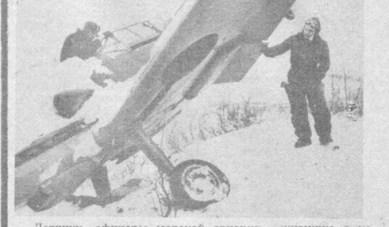
Летчики, офицеры морской авиации, живущие в небольшом военном городке, — герои фильма «Торпедоносцы», действие которого происходит в сорок четвертом году на Северном флоте. Автор сценария — С. Кармалита. Режиссер — С. Аранович. В ролях: Р. Нахашетов, А. Жарков, В. Глаголева, Н. Лушавенч, Т. Кравченко. Производство киностудии «Ленфильм».

РЕСПУБЛИКАНСКАЯ КОНТОРА ПО ПРОКАТУ КИНОФИЛЬМОВ ДЕМОНСТРИРУЕТ НОВЫЕ ХУДОЖЕСТВЕННЫЕ ФИЛЬМЫ «ТОРПЕДОНОСЦЫ»