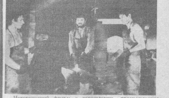
Исторический фильм о зарождении промышленного Урала в эпоху Петра I. Авторы сценария — Э. Володарский, В. Акимов. Режиссер — Я. Лапшин. В ролях: Е. Евстигнев, В. Спирidonov, А. Лазарев, М. Козаков, Л. Полежаева, Т. Ташкова, Л. Куравлев. Производство Свердловской киностудии.