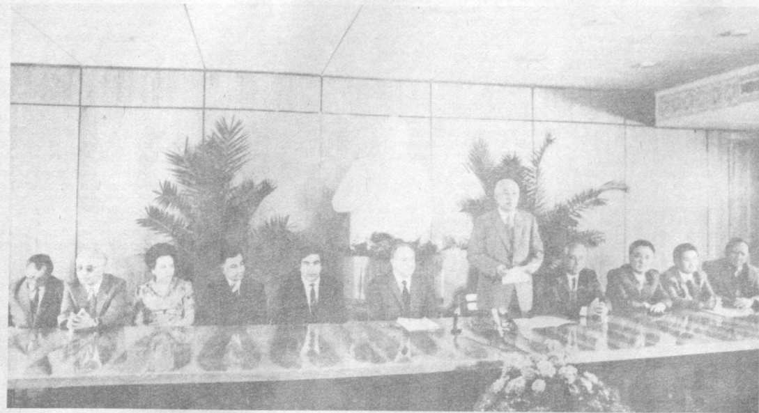
Во время встречи.