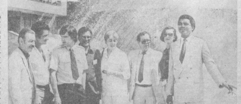
На снимке: группа членов секретариата Межправительственного совета Международной программы развития коммуникации ЮНЕСКО.

Общественность Узбекистана широко отметила национальный праздник Социалистической Республики Вьетнам — 38-ю годовщину провозглашения независимости.