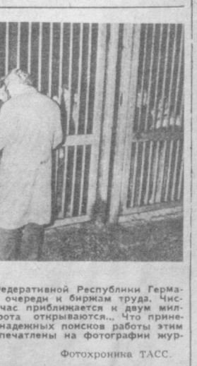
Еще до рассвета в городах Федеративной Республики Германия выстраиваются огромные очереди и биржам труда. Число безработных в стране сейчас приближается к двум миллионам. И вот, наконец, ворота открываются... что принесет очередной день безработицы? На снимке: очереди к биржам труда, которые запечатлены на фотографии мурала «Штерн».

А как сообщает Евразийское информационное агентство (ПАНА), один человек убит и двое ранены в результате новой вооруженной провокации расистской ЮАР против Лесото — небольшой страны на юге африканского континента. В приграничном населенном пункте Морифи