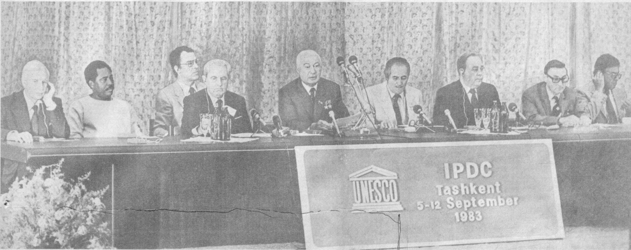
На снимке: открытие IV сессии Межправительственного совета Международной программы развития коммуникации ЮНЕСКО.