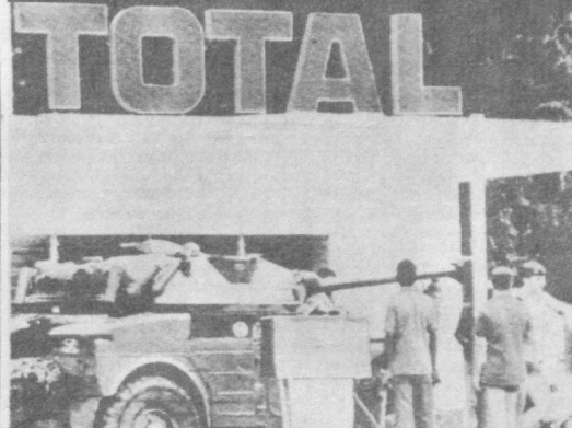
Франция продолжает наращивать масштабы военной интервенции в Чаде. Как отмечает газета «Таймс», французские войска в Чаде приведены в состояние боевой готовности номер один. На снимке: французские военнослужащие в Иджаме.

Нарастает недовольство чадского населения антинародным курсом режима Хабре и империалистическим вмешательством во внутренние дела страны. По сообщению АФП, в Иджаме произошел сильный взрыв. Как указывает «Юманите», события на севере злословно развиваются. В южных районах, где население выступило против войск режима. Если столкновения в этом важном экономическом районе будут продолжаться, отмечает газета, то позиции Хабре значительно ослабнут. Хиссен Хабре никогда не смог бы захватить власть, если бы не получил в свое распоряжение 10 млн. долларов и оружие из США, пишет «Монд дипломатик». Точно так же, продолжает газета, удержаться у власти и вести войну против сил ПНЕ Хабре помогли посланные в Чад зарплате войска, завербованные в Западной Европе наемники, а также огромные поставки французского и американского оружия и 25 млн. долларов в качестве «подарка» президента Рейгана.