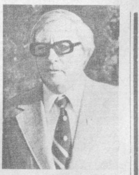
полного любви к родному Ташкенту.

В работе комиссии приняли участие член Политбюро, первый секретарь ЦК КПСС М. С. Горбачев, член Политбюро, первый секретарь МК КПСС В. В. Гришин, кандидат в члены Политбюро ЦК КПСС, первый заместитель Председателя Президиума Верховного Совета СССР В. В. Кузнецов.