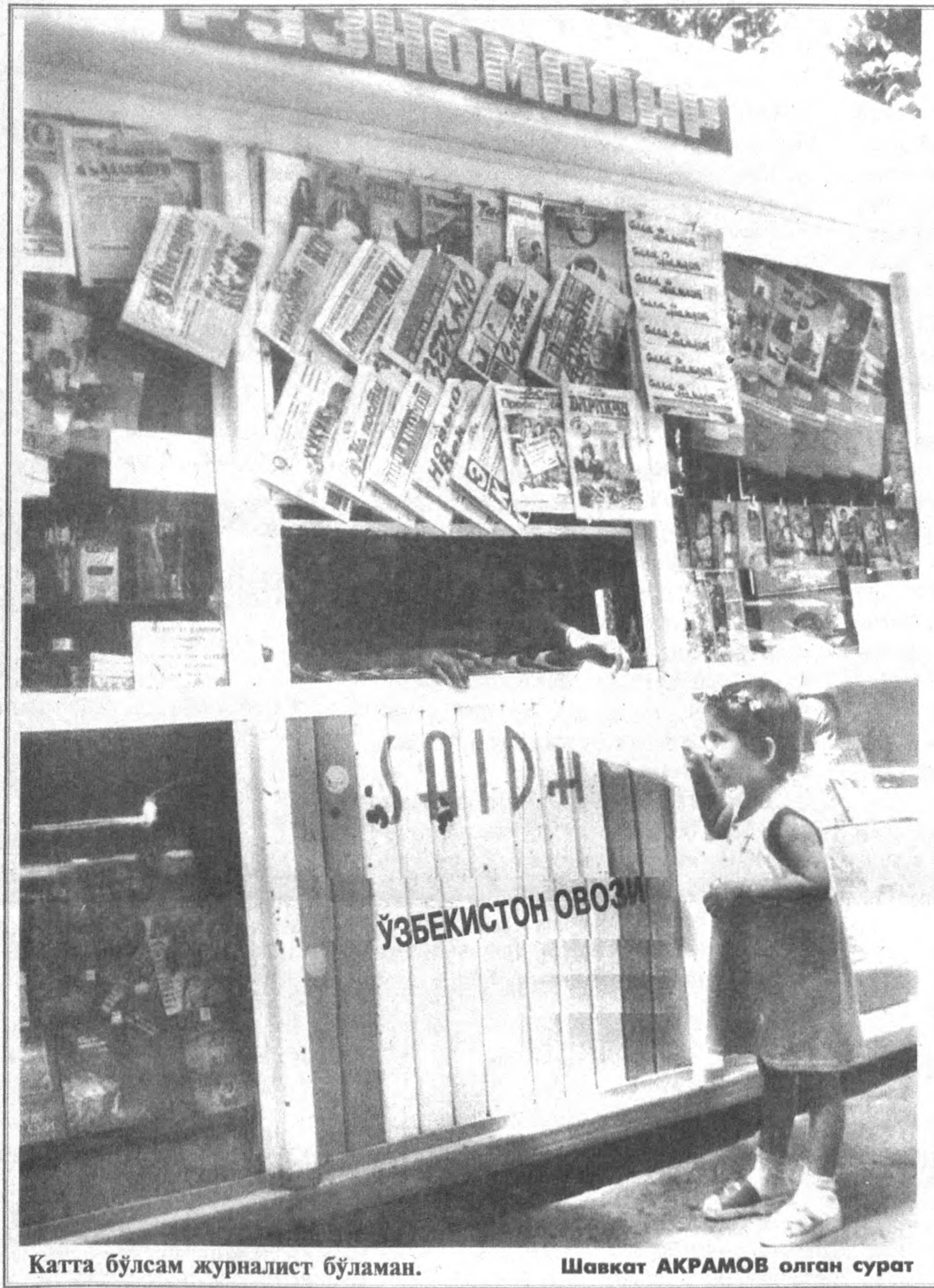
Катта бўлсам журналист бўламан.

Газетхонлик — Газета ўқиб, газета ўқиш билан машғул бўлиш.