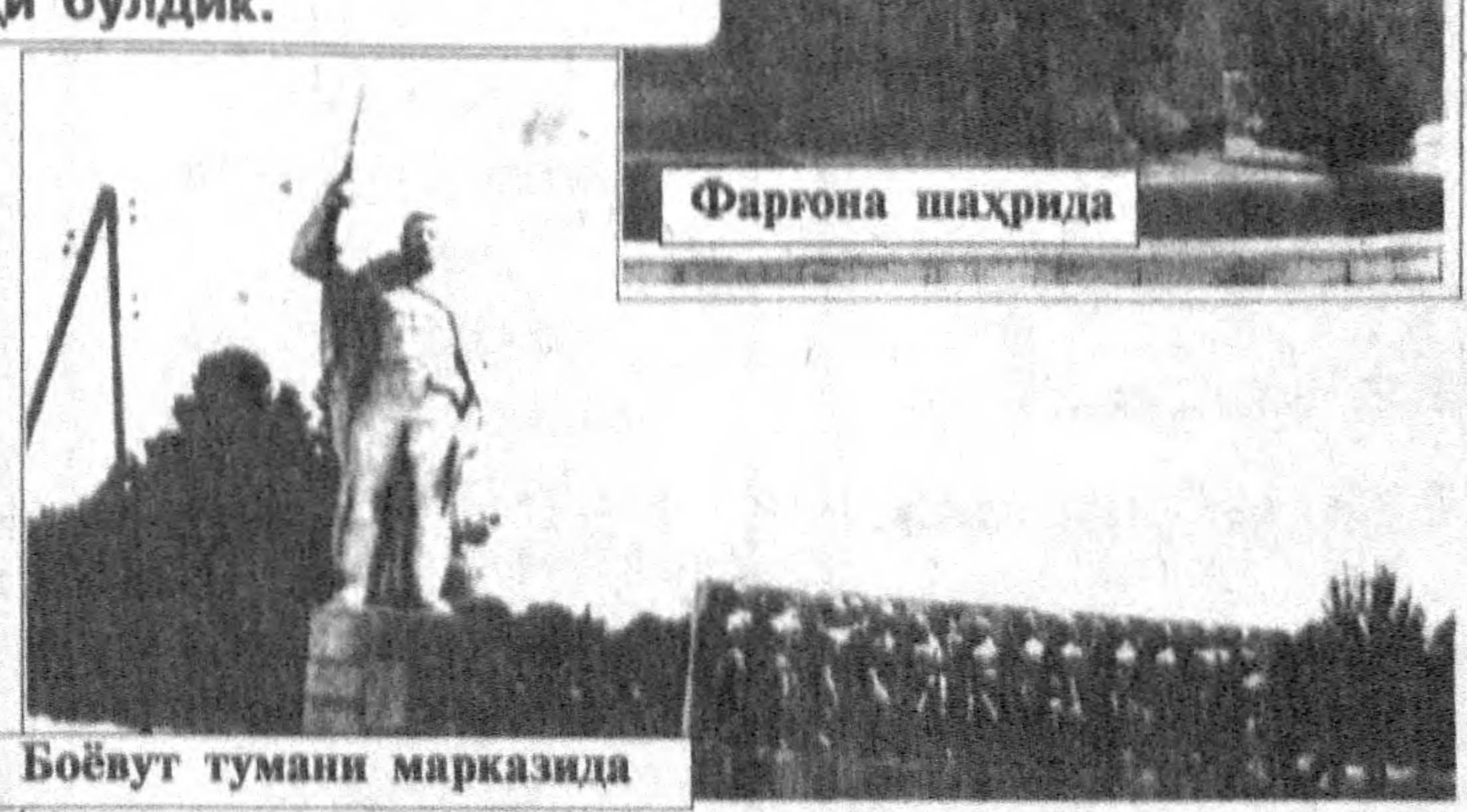
Шу йил 9 май — Хотира ва Қадрлаш куни мамлакатимиз раҳбари мафкуравий бўшлиқлар ҳақида гапирар экан, ҳамон жойларда собиқ шўро сиёсатининг излари мавжудлигига эътиборни қаратган эди. Шундан сўнг биз мамлакатимизнинг турли бурчлари — кишлоқ ҳамда шаҳарларини айланиб чиқдик ва қуйидаги суратлардаги каби манзараларнинг гувоҳи бўлдик.