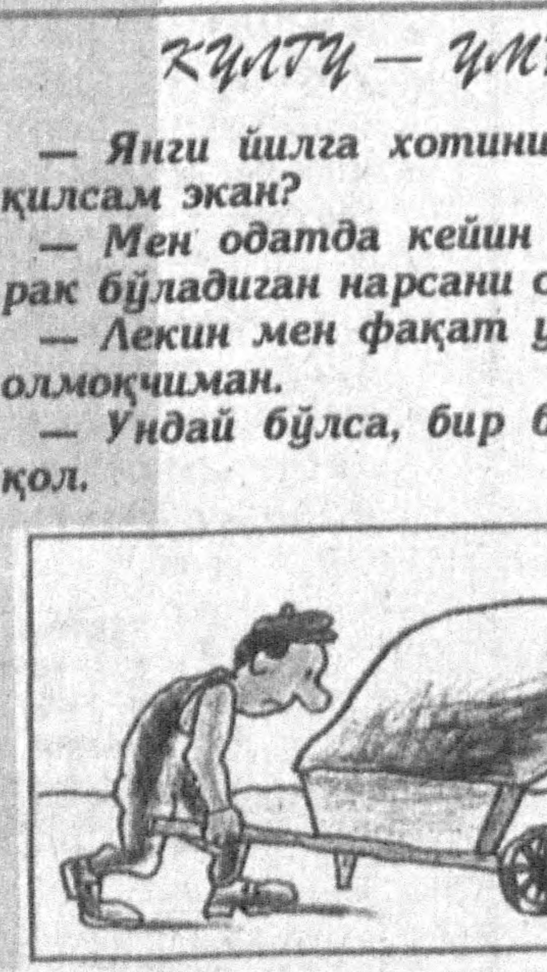
Қизга — чир зотини

Тошкент шаҳар Хужалик судининг 1999 йил 30 ноябрдаги № 3339-Э сонли қарорига биноан «Моҳир Бинокор» акциядорлик жамияти баъкорот деб эълон қилинди.