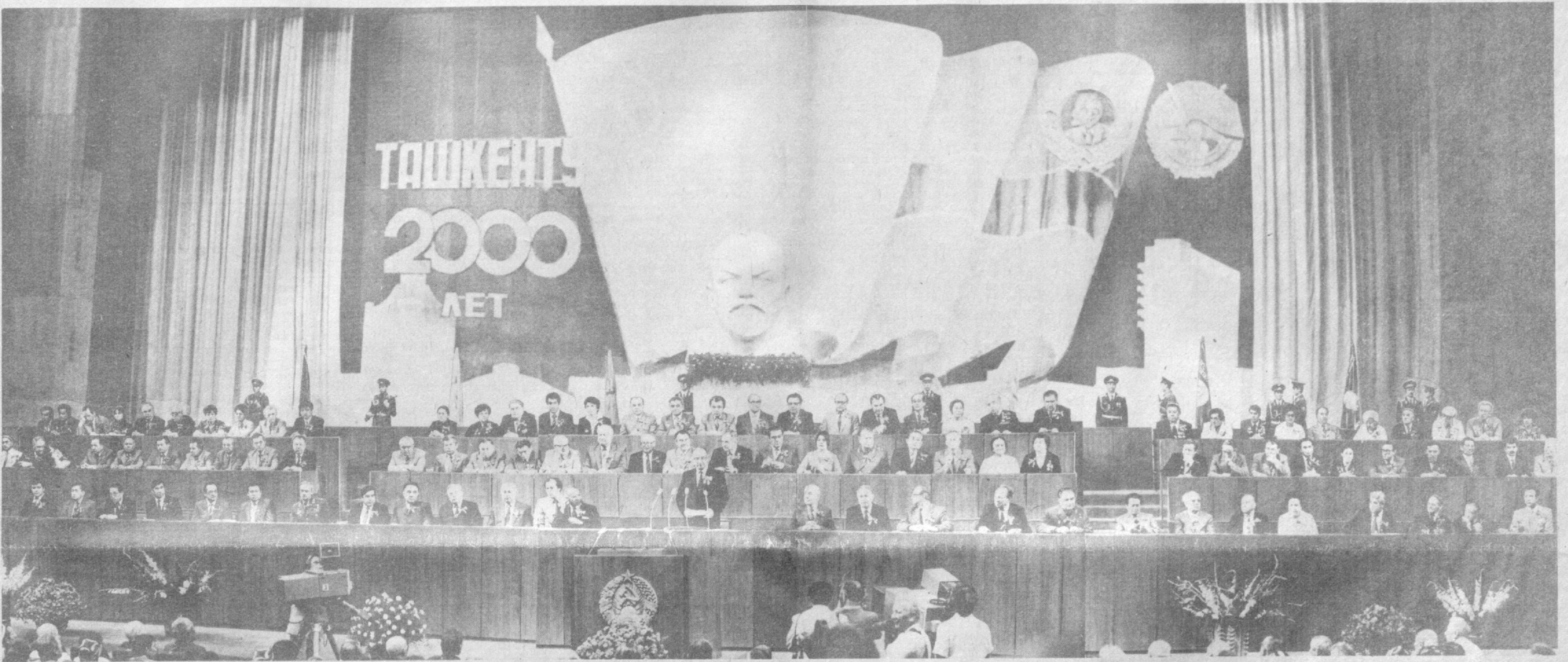
В президиуме торжественного собрания, посвященного 2000-летию Ташкента и вручению городу ордена Ленина.