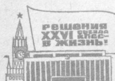
Решения XXVI съезда ВПЗ в жизнь!