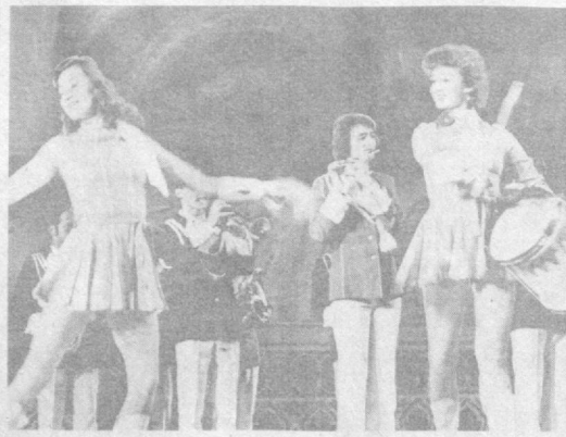
Государственный оркестр духовых инструментов Литовской ССР «Триумф» — участник фестиваля «Ташкентская золотая осень».

По всему Узбекистану развилась мелодия Второго всесоюзного фестиваля искусств «Ташкентская золотая осень». По доброй традиции его участниками стали представители всех областей республики и Каракалпакской АССР. В их распоряжение предоставлены лучшие сценические площадки, дворцы культуры, клубы. Прославленные художественные коллективы и солисты из братских республик проведут цикл творческих вечеров-встреч с труженниками промышленных предприятий, колхозов и совхозов, студентами, учащимися. В Ташкентском Дворце