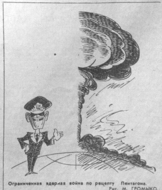
Ограниченная ядерная война по рецепту Пентагона.

▲ НЬЮ-ЙОРК. Администрация Рейгана, финансируя подрывную деятельность против Никарагуа, нарушает устав Организации американских государств, заявил сенатор А. Кранстон, выступивший в нью-йоркском совете по международным отношениям. «Дипломатия канонеров, на которой основан ее курс в Центральной Америке, сводит на нет все усилия латиноамериканских стран по установлению мира в этом регионе. Сенатор обвинил администрацию в проведении политики, направленной на поддержку жестоких военных диктатур,