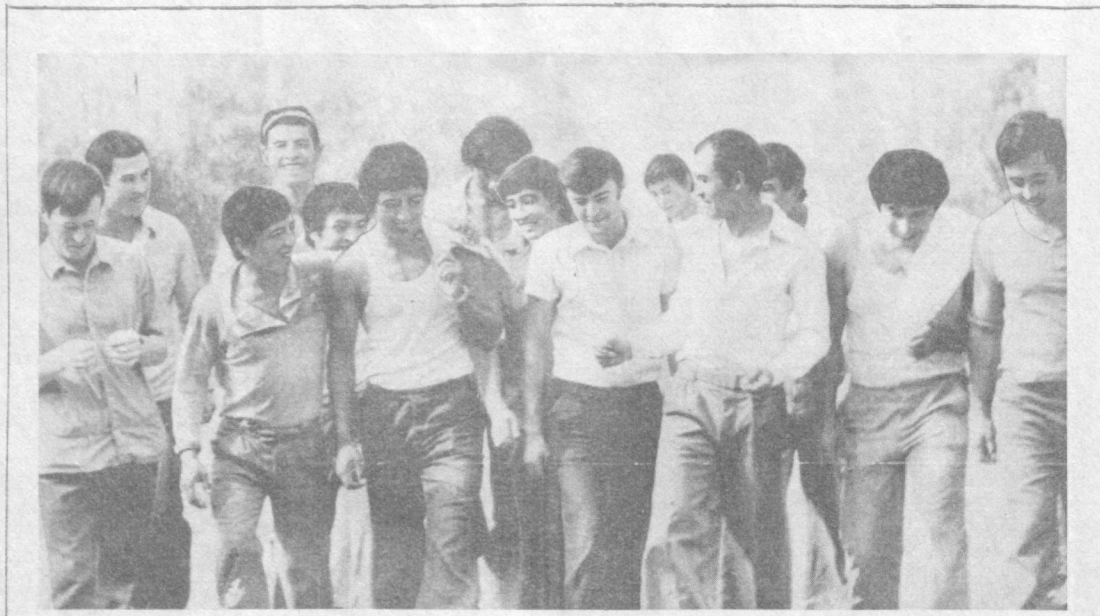
СПОРТ И ТРУД РЯДОМ ИДУТ

Под таким девизом работает молодежь спортивно-трудовой бригады садово-огороднического совхоза «Победа» Янгирского района Наманганской области. Названия бригады — спортивно-трудовая — получила потому, что в ней объединены лучшие физкультурники совхоза. Все двадцать