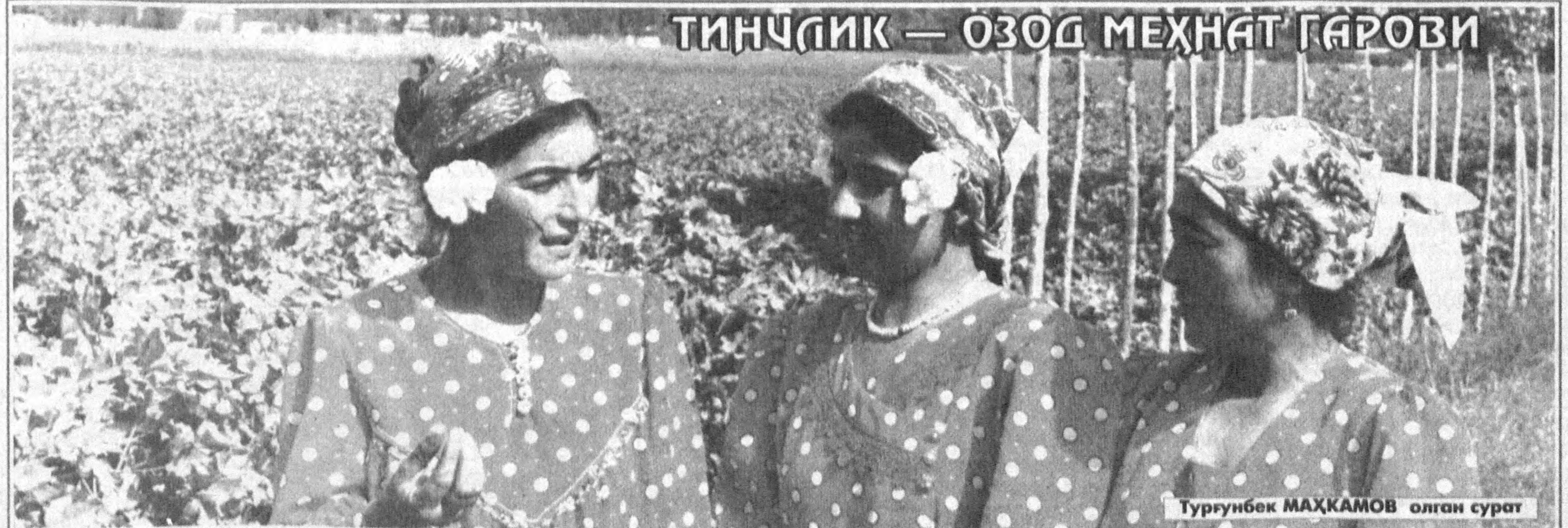
ТИНЧЛИК — ОЗОД МЕҲНАТ ГАРОВИ