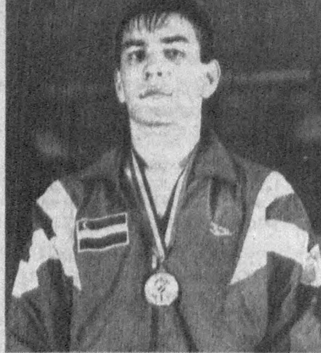
96 кун деганда олимпиада пойтахтига етказиб келинди. Ҳамини бундан кейин, энг йирик спорт анжумани — олимпиаданинг очилиши бу сафар ҳам бетакор воқеаларга бой бўлди, байрамона тус олди. Машғуланинг ёндарилиши ҳам ўзига хос усулда амалга оширилди. Аёнки, олимпиаданинг тимсоли бешта туташ ҳалқадан иборат. Бу дегани, бешта китъа мамлакатларида олиб борилган олимпиа ҳаракатларининг мақсади битта, у ҳам бўлса, халқлар ўртасида тинчлик, бирдамлик ва дўстлик ришталарини янада мустақамлаш, инсон боласининг жисмоний имкониятларини нечоғли беадад эканини миллионлар кўз ўнгига намоиш этишдан иборатдир. Дунёнинг юзлаб давлатларидан ташриф буорган энг мохир спортчилар аввало қолиблик учун курашчилар, қолаверса, олимпиадачи номини олганликлари билан фахрланадилар. Улар 18 кун мобайнида лавулаб турган машғуладан руҳланиб, қизгин ва муросасиз баҳсларда ўзларининг маҳоратларини кўрсатадилар. Мустақиллик йилларида Ватанимиз ўғил-қизлари учинчи марта олимпиада мусобақаларида

Австралиянинг Сидней шаҳрида олимпиада машғулаши лавламоқда. Узоқ Афганистон қадимий Олимп қишлоғида рамзий равишда ўт олдирилган машғула