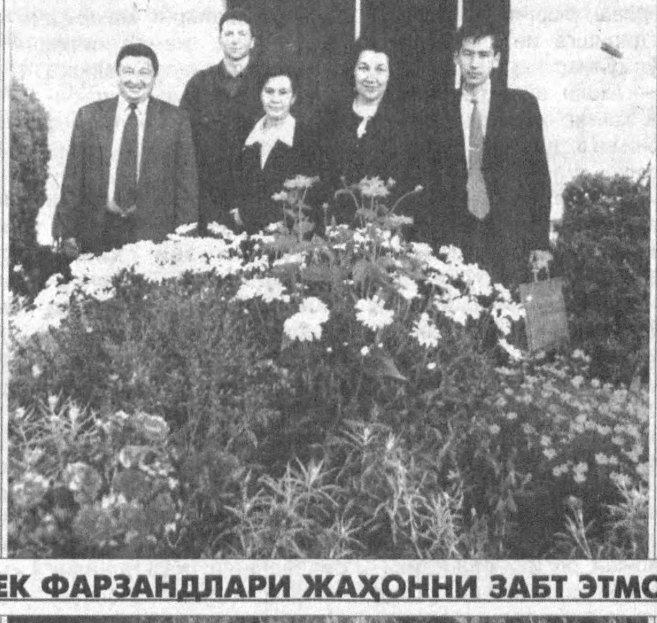
ЎЗБЕК ФАРЗАНДЛАРИ ЖАҲОННИ ЗАБТ ЭТМОҚДА