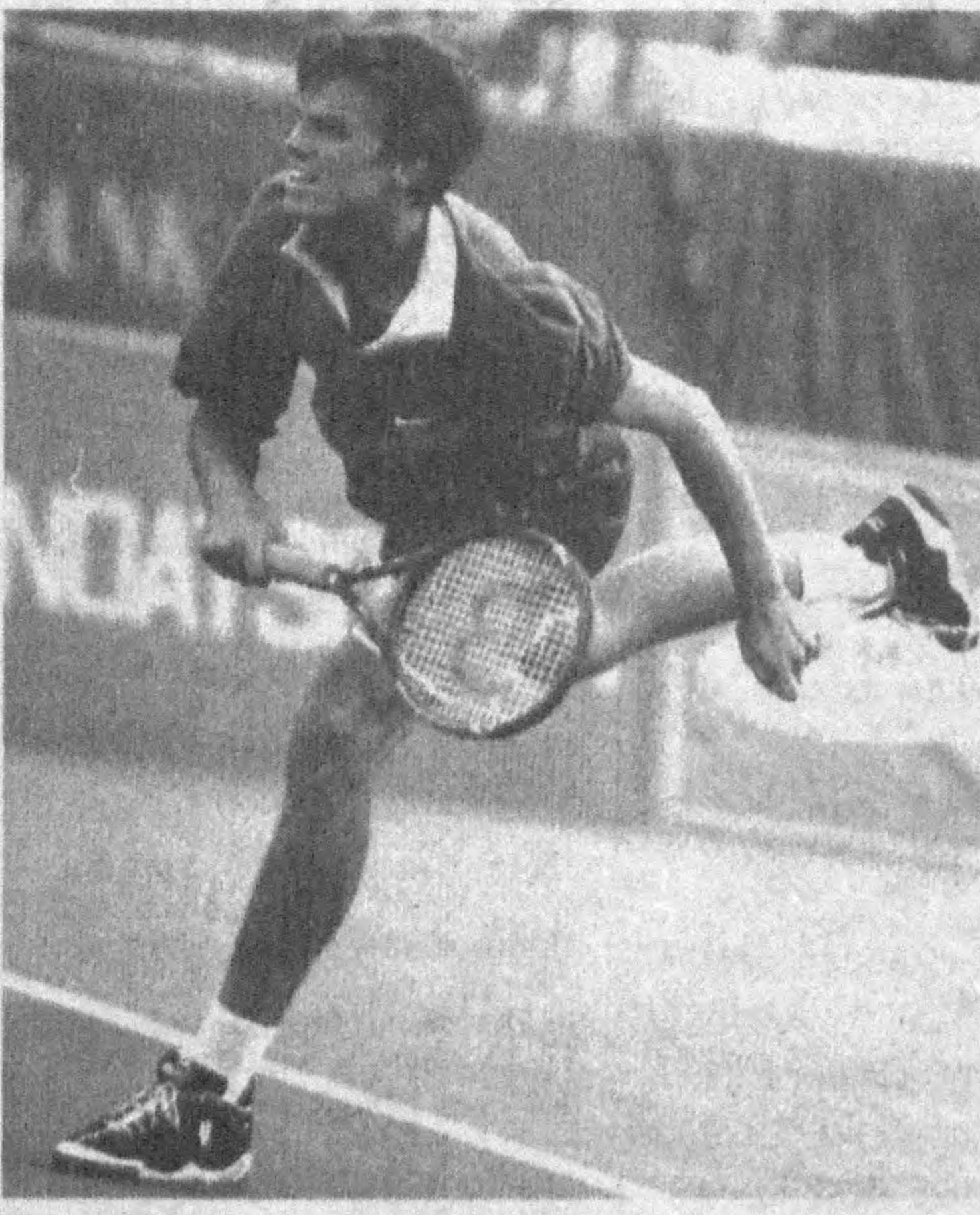
қаро теннис мусобақалари ўтказишга мўлжалланган мажмуалар ҳамда «Олимпиада шон-шухрати музейи»

эгаллаб турган бу ажиб инсон матбуот йиғилишларида ўз таассуротларини тўкиб солди. Унинг таъбири билан айтганда, шу пайтагача Тошкентда «Президент кубоги» учун ўтказилган мусобақа ҳақидаги аjoyиб таассуротлар ҳақида кўп эшитгани ва бунга нахотки деб қарагани ҳақида сўзлади. Демак, халқ ибораси билан айтганда, юз бор эшитгандан кўра, бир бор кўрган яхши. Ижрочи директор Тошкентда бунёд этилган спорт иншоотлари, халқаро теннис мусобақалари ўтказишга мўлжалланган мажмуалар ҳамда «Олимпиада шон-шухрати музейи»