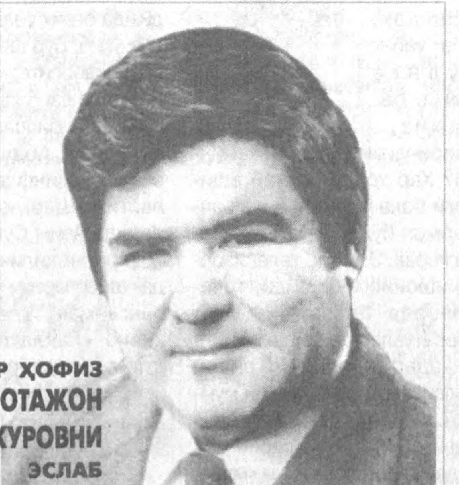
МАШХУР ҲОФИЗ ОТАЖОН ХУДОЙШУКУРОВНИ ЭСЛАБ

ланган куй-қўшиқлар билан бойитди. Шу билан бирга ҳофиз ўз ижодини халқимизнинг ардоқли шоирлари Абдулла