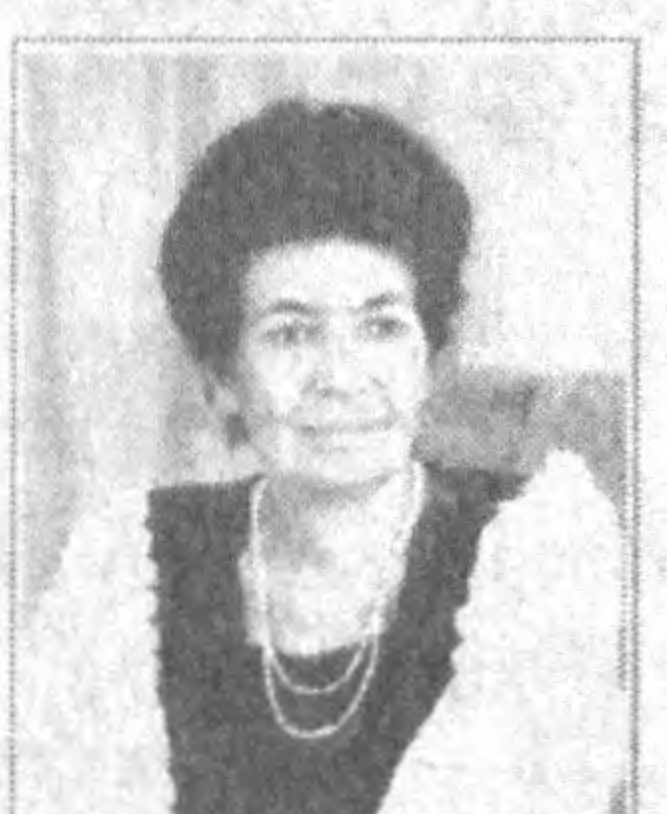
Малика Мирзеванинг портрети