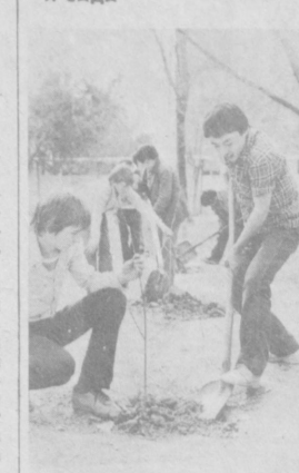
НА СНИМКЕ: воспитанники детского дома № 21 г. Ташкента ведут посадку фруктовых деревьев.