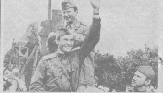
Республиканская контора по прокату кинофильмов.

19 апреля СОСТОИТСЯ ВСЕСОЮЗНАЯ ПРЕМЬЕРА ДВУХСЕРИЙНОГО ФИЛЬМА «ПОБЕДА» (по мотивам одноименного романа А. Чаковского). Авторы сценария — Вадим Трунин, Евгений Матвеев. Режиссер-постановщик — Евгений Матвеев. В основу фильма легли два исторических события: Подсмакская конференция глав правительств трех держав — СССР, Англии и США, проходившая в 1945 году, и совещание по безопасности и сотрудничеству в Европе, состоявшееся в 1975 году в Хельсинки. Оба эти события проходят перед глазами главного героя картины, советского журналиста Воронина. В ролях: Александр Михайлов, Андрей Миронов, Рамиз Чикибаев, Георгий Менглер, Альгимантас Масюлис, Михаил Ульянов, Евгений Матвеев. Совместное производство киностудий «Мосфильм» (СССР) и «ДЕФА» (ГДР) при участии В/О «Совинфильм» (СССР), «СКТ» (Финляндия).