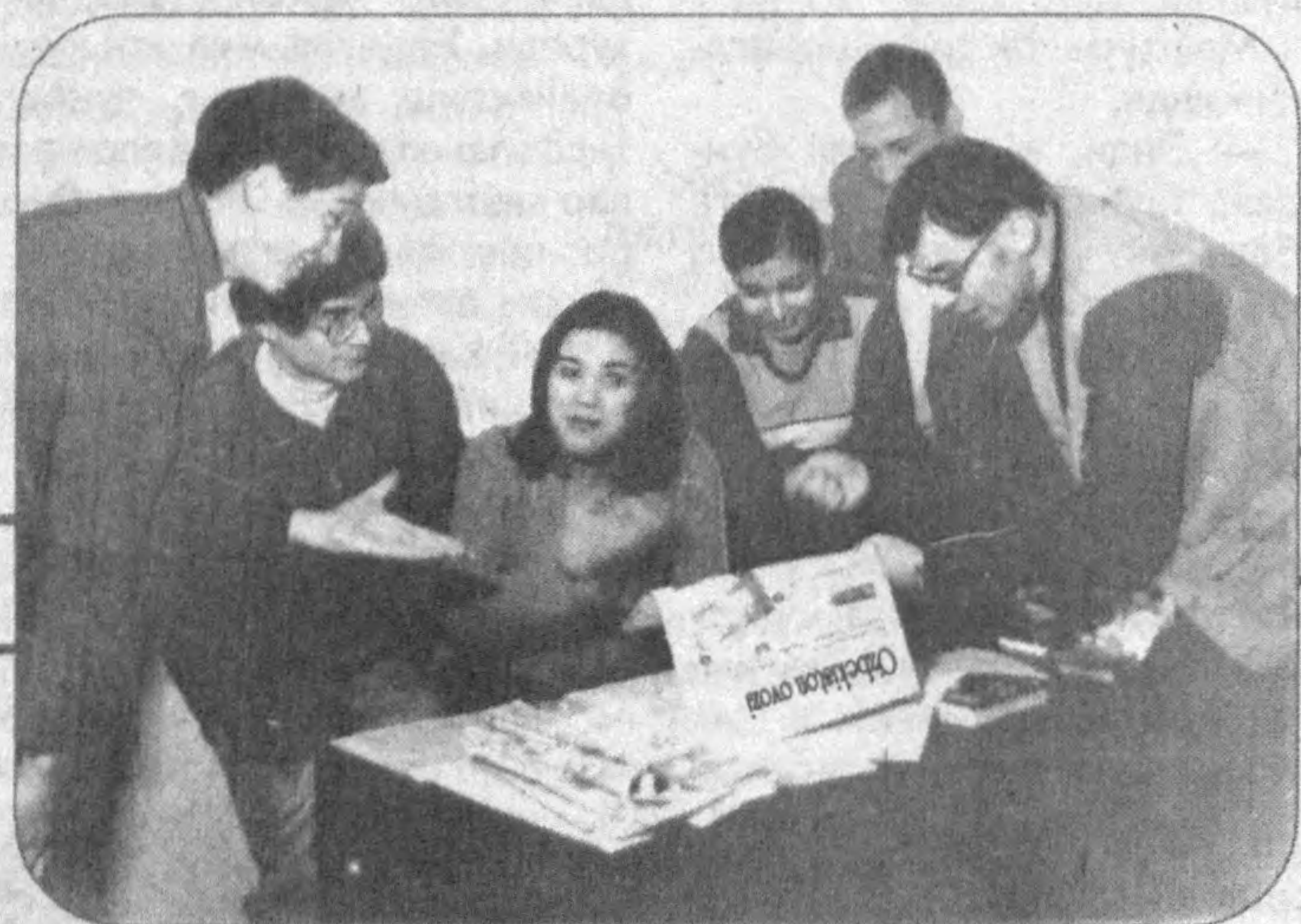
Ўтган вақт мобайнида қатор ёш истеъодлар кашф этилишига эришилди...