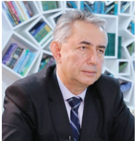
Муродулла ХОЛМУҲАМЕДОВ, олий ва ўрта махсус таълим вазири ўринбосари

Президентимизнинг Олий Мажлиси Мурожаатномасида мамлакатимизда 2020-2021 ўқув йилидан бошлаб кадрлар малакасини халқаро меҳнат бозори талабларига мослаштириш мақсадида Миллий малака тизимини ишлаб чиқиш, юртимизда 340 та касб-хунар мактаби, 147 та коллеж ва 143 та техникум ташкил этиш бўйича аниқ вазифалар белгилаб берилган эди.