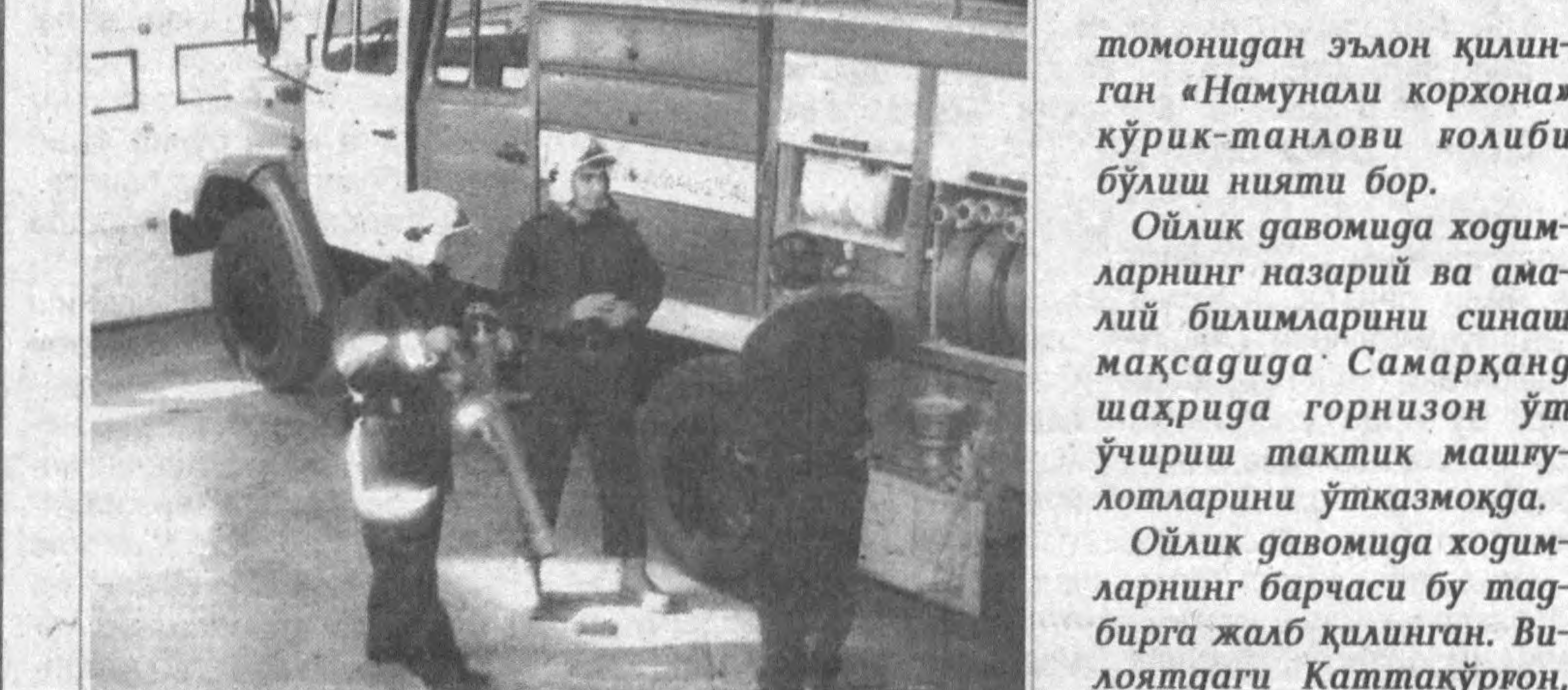
томонидан эълон қилинган «Намунали корхона» кўрик-танловига қолиби бўлиш нияти бор. Ойлик давомига ходимларнинг назарий ва амалий билимларини синаш мақсадига Самарқанд шаҳрида горнизон ўт ўчириш тактик машғулотларини ўтказмоқда. Ойлик давомига ходимларнинг барчаси бу тадбирга жалб қилинган. Вилоятдаги Каттақўрғон, Пахтачи, Оқдарё, Темиръул туман мустақил ҳарбийлашган ўт ўчириш қисми ва давлат ёнғиндан сақлаш назорат бўлинмалари ҳамкасбларга ўрнак. Суратларда: машғулотлардан айрим лавҳалар.

Ўзбекистон Республикаси Вазирлар Маҳкамасининг шу йил 11 ноябрдаги фармойиши асосига Самарқанд вилояти ИИБ Ёнгиндан сақлаш бошқармасига кўлгича ишлар амалга оширилмоқда. «Ёнғин хавфсизлиги ойлиги» давомига вилоят ҳуquуquдаги ва халқ хўжалиги объектлари ёнғин хавфсизлиги чораларини кучайтириш борасида кўрик-танловлар, викториналар, учрашувлар ташкил этилмоқда. Асосий эътибор газ-электр хўжалиги, иситиш мосламаларининг соз ишлатилишига қаратилган. Ёнғиннинг олдини олишга кенг жамoатчилик жалб қилинган. — Бришши Американ табакко компаниясига