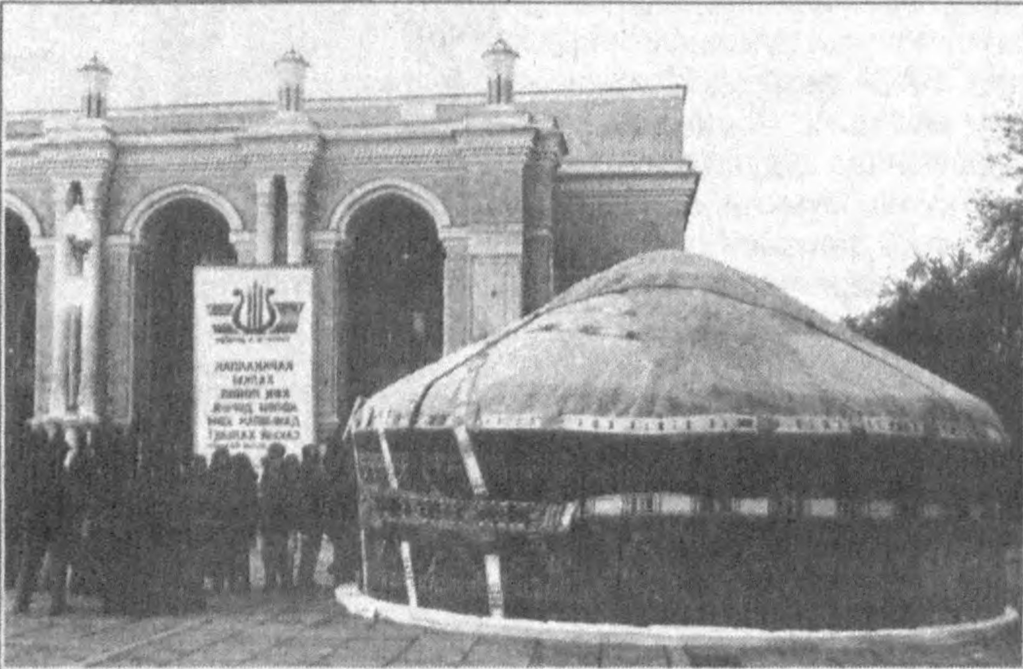
Суратларда: Қорақалпоғистон маданияти кунларидан лавҳалар.

нинг мамлакатимиз Прези- денти Ислам Каримовга йўллаган Мурожаатномасида ана шундай ҳароратли сатр- лар бор. Мурожаатнома аср- лар оша ўз эркини, бахтини излаб, қўмсаб келган қора- қалпоқ халқи бугунги кунда ўз саодатини, бахтини бутун Ўзбекистон, ўзбек халқи бил- лан бирга кўраётганлигидан чекиз гурур ва ифтихор ҳисси билан йўрилган. Мух- тор Ашрафий номидаги Тош- кент давлат консерватория- си, «Баҳор» концерт зали, Республика кўйрақчоқ театри ва кинотеатрлар ҳам қора- қалпоқ санъати ихлосманд- лари билан янада гавжум