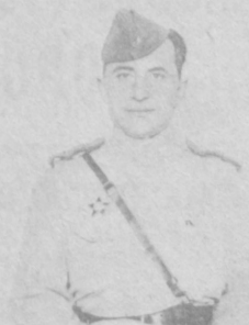
Много горя вынесли в войну советские солдаты и их семьи. Но не ожесточились, оставались всегда воинами-освободителями.