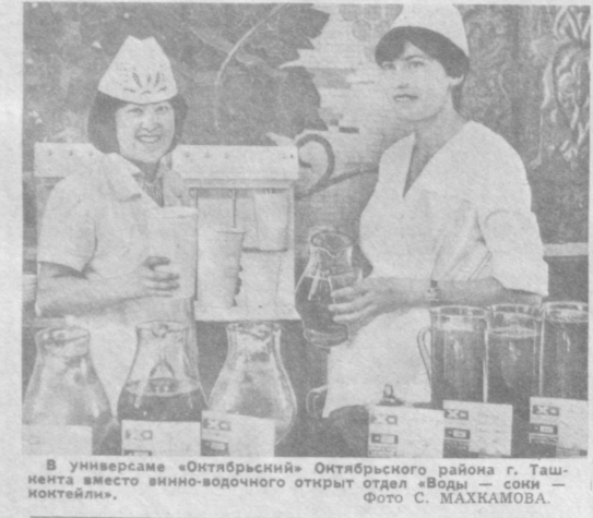
В университете «Ойтабский» Ойтабского района г. Ташкента вместе вино-водочного отдела «Воды — соки — коньяк».