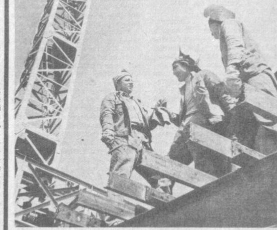
В городе Дружба Хорезмской области на берегу Амударьи полным ходом идет строительство Хорезмского агрегатного завода. На большой площадке раскинулись производственные корпуса. Пуск первой очереди намечается к 1 января 1990 года. Строительство на участке ведет управление «Тяжмашиндустрия».

Важнейший вопрос, на который предстоит дать исчерпывающий и точный ответ: достаточно ли радикальны предлагаемые меры, нельзя ли уже сегодня продвигаться гораздо дальше в формировании правовых основ социалистической рыночной экономики? Не преваряя итогов дискуссии, выскажу свою точку зрения по этому поводу.