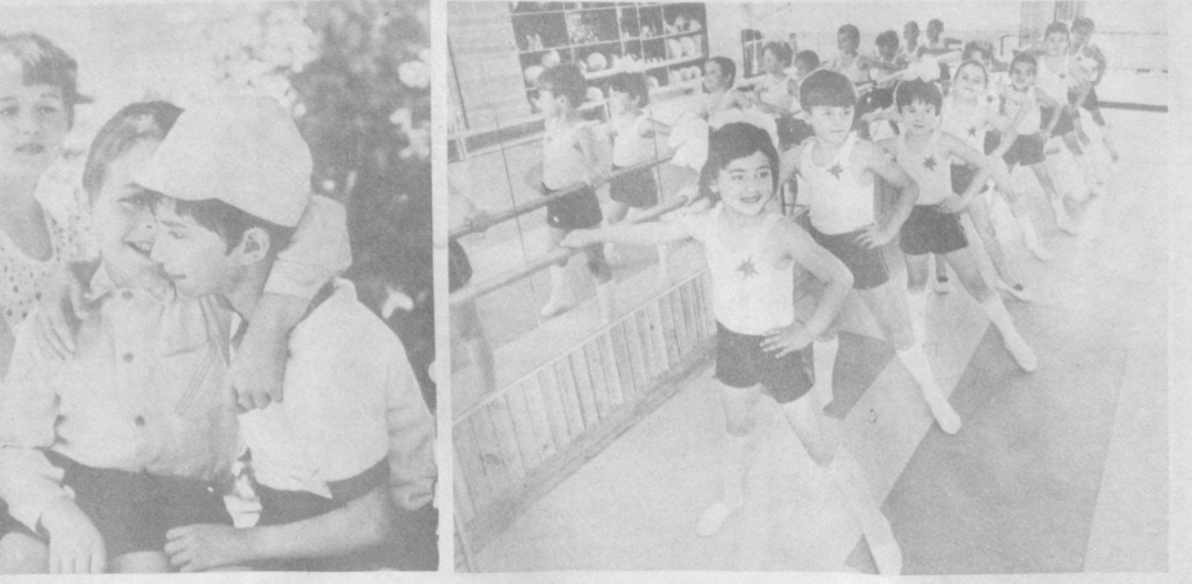
Так без преувеличения можно назвать детский сад «Радость», в котором воспитываются более 320 детей нагойских строителей. Во всем здесь ощущается большая любовь и забота о растущем поколении. Шесть работников городского управления строительства — позаботились о том, чтобы отлично оборудовать игровые площадки и спортивный зал. Воспитатели умело применяют комплексную программу гармоничного развития малышей, широко используют при этом увлекательные игры. Дети в молодом городе не на словах, а на деле чувствуют себя единственными привилегированными классами. НА СНИМКАХ: по секрету; занятия воспитанников подготовительной группы в спортивном зале детского сада «Радость».

В прошедшем туре команды восточной зоны, занимающей наиболее высокие места в турнирной таблице, встречались между собой в Хабаровске ярославский «Шинник» против «Амурского» с крупным счетом — 5:1. Правда, на турнирное положение хабаровчан это не повлияло. Они с 15 очками по-прежнему идут третьими. А вот «Шинник» (18 очков) продолжает уступать место лидера дуэли «Памир» — «Амур», выигравшему у «Памира» — 2:1. У ташкентских футболистов тоже 16 очков, но больше побед. Более 20 тысяч дуэлишников пришли посмотреть матч «Памира» с «Памиром» в Омске. Игры были интересней. Уже на 5-й минуте Азимов сильнейшим ударом из-за штрафной послал мяч в ворота ташкентцев. На 18-й минуте Денисов с пенальти восстановил равновесие. Хорошие возможности выйти вперед были у пахтанорцев Зейтуллаева, Шыгырина. Но их удары не достигли цели. В конце первого тайма Манасид забил победный гол. Редактор Н. Ф. ТИМОФЕЕВ.