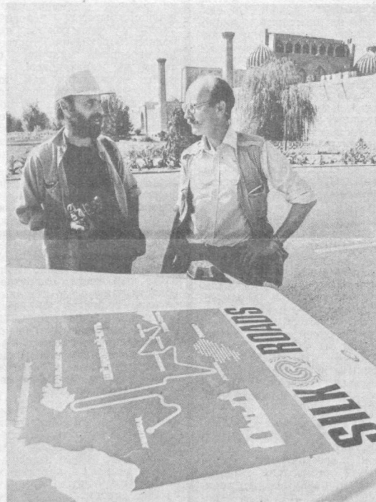
«ГРАН-ПРИ» — УЗБЕКИСТАНЦАМ