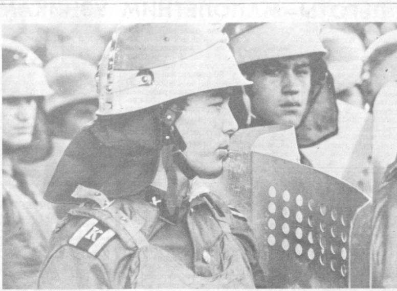
ТАШКЕНТ. Впервые в нынешнем году в пожарной училища страны стали принимать курсантов не только отслуживших армию, но и выпускников средних общеобразовательных школ.

По вопросам, связанным с условиями выдвижения на премии, обращаться в Комитет по Государственным премиям Узбекской ССР имени Беруни по адресу: г. Ташкент, ул. Гоголя, 70, комната 7. Телефон 33-74-82.