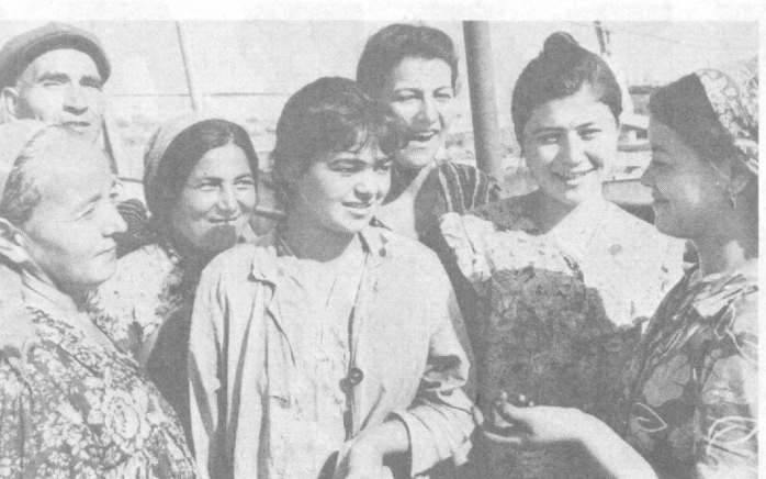
Ургенчский масложирнокомбинат — один из ведущих предприятий в Хорезмской области. Годовой выпуск продукции составляет более 38 млн. рублей основных видов — растительное масло, хозяйственное мыло, дистиллированные жиры, кислоты.