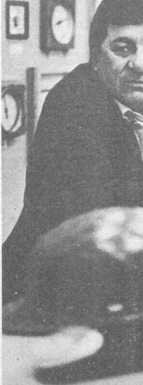
СПОКОЙНЫЙ, уравновешенный, он произносит слова, будто взвешивая каждое.

На заседании рассмотрен вопрос о серьезных недостатках в организации выполнения постановления ЦК Компартии Узбекистана, Президиума Верховного Совета Узбекской ССР и Совета Министров Узбекской ССР от 15 августа 1989 года «О дальнейшем развитии жилищного строительства жилищных комплексов, рабочих совхозов, граждан и индивидуального жилищного строительства в Кашкадарьинской и Сырдарьинской областях. В ходе обсуждения отмечено, что со дня принятия постановления в целом по республике участки получили более полумиллиона семей, им выделено около 70 тысяч гектаров земли. Однако уровень организаторской и политической работы многих обкомов и райкомов партии не соответствует требованиям постановления и не обеспечивает выполнение заданий по ускоренному развитию жилищного строительства в Кашкадарьинской и Сырдарьинской областях. Положительным является увеличение объемов и индивидуальное жилищное строительство здесь после выхода постановления практически не ухудшается. На день проверки ни в одном хозяйстве Сырдарьинской области не были выделены дополнительные земельные участки для этих целей, в то время как неудовлетворенные потребности на получение участков и их расширение имелись у 140 тысяч семей или 90 процентов от всех проживающих в сельской местности; в Кашкадарьинской области эти показатели были соответственно 90 тысяч и 50 процентов. В названных областях, подчеркивалось на Бюро, земельные наделы остаются самыми малыми в республике.