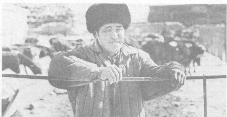
Живут в Бахмале киргизы