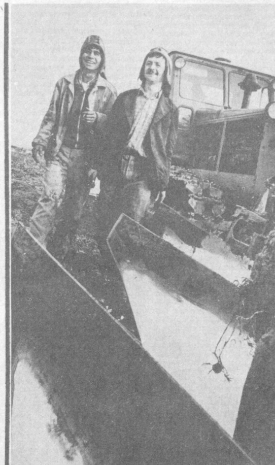
ПЛУГ — В БОРОЗДУ

В нынешнем году погода благоприятствует земледельцам как никогда. Даже пахота для механизаторов проходит, можно сказать, в «идеальных» условиях. Это позволило многим хозяйствам Пискентского района завершить подъем зяби намного раньше, чем в прошлые годы.