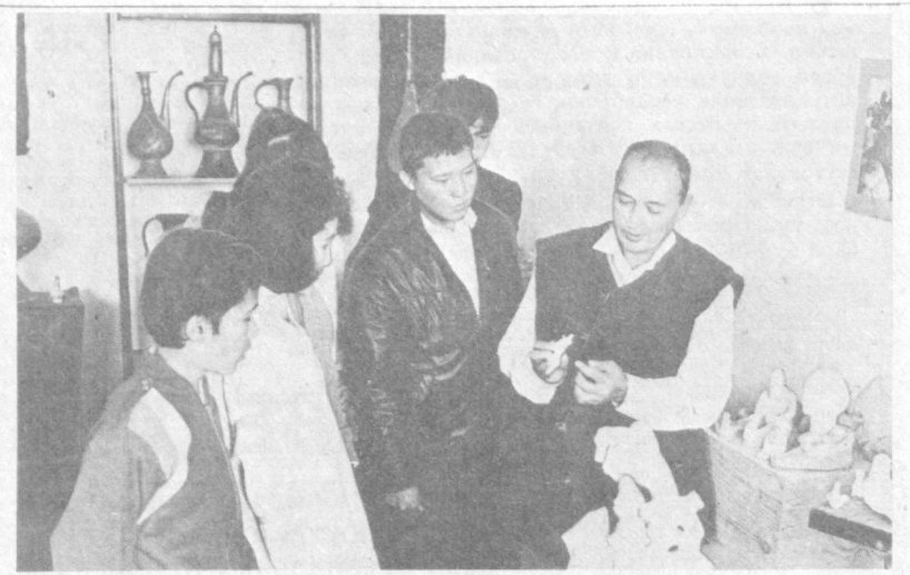
КАРАКАЛПАКСКАЯ АССР. Постоянная экспозиция работ известного скульптора Жолдасбека Куттымуратова открыта в одном из залов Государственного музея искусств имени И. В. Савицкого в столице автономной республики. В дар музею Ж. Куттымуратов передал серию скульптур, посвященных каракалпакской женщине.