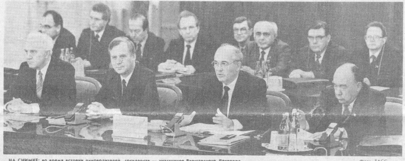
НА СНИМКЕ: во время встречи руководителей государств — участников Варшавского Договора.

Отмечалось, что Социалистическая единая партия Германии готовится к своему чрезвычайному съезду, на котором предстоит сформировать руководство, способное вернуть партии авторитет одной из главных сил общественного прогресса в ГДР.