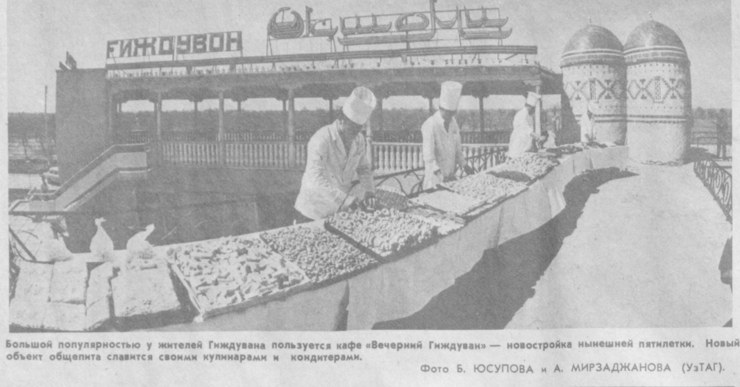
Большой популярностью у жителей Гиджудвана пользуется кафе «Вечерний Гиджудван» — новостройка нынешней пятилетки. Новый объект общепита славится своим кулинарным и кондитерским.

С. ИРИСХОДЖАЕВА. Кандидат филологических наук.