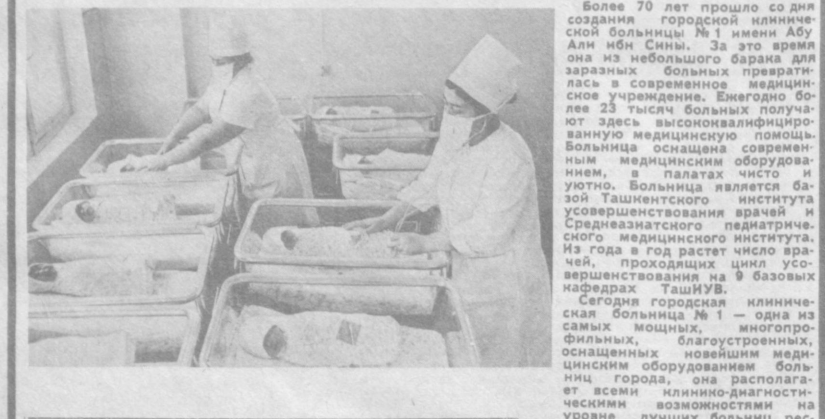
Сегодня — день медицинского работника