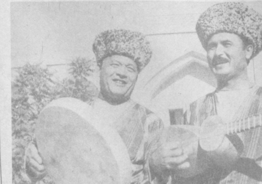
Фольклорный ансамбль «Ауэхан» из Шавагского района часто выступает перед туристами села и коллективами предприятий.

«Плот на стремине. Сейчас главное — не дать ему развиться, иначе точно войти в порог. Время как бы остановилось. Чувствую, как руки влились в грёб (управление плота), готовое рвануть его по первой команде напавшего. Вот он, порог! Трёхметровый вал пронёсся через плот. Команда, свалились, ловит очередной вал и осуществляют задуманный маневр».