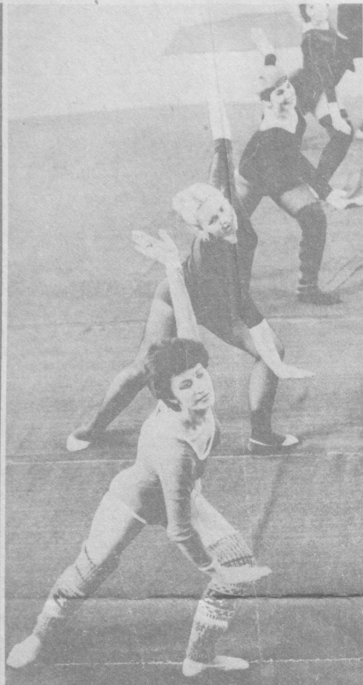
Стремительно растет в столице республиканская популярность ритмической гимнастики или аэробики, как ее еще называют. Всего полгода существует секция ритмической гимнастики при спортивном обществе «Трудовые резервы», а сейчас в ней занимается более 250 человек.

ФЕРГАНА. (Общ. корр. М. Лурье). При областной кинотеке начал действовать клуб друзей кино. Два раза в месяц на заседаниях члены клуба знакомятся с классикой мирового кино.