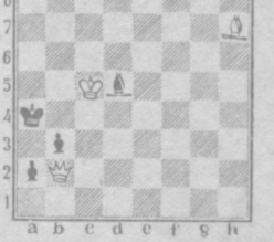
Мат в два хода