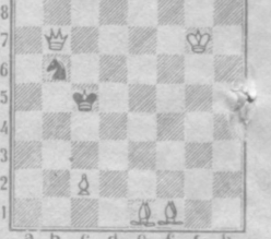
Мат в три хода