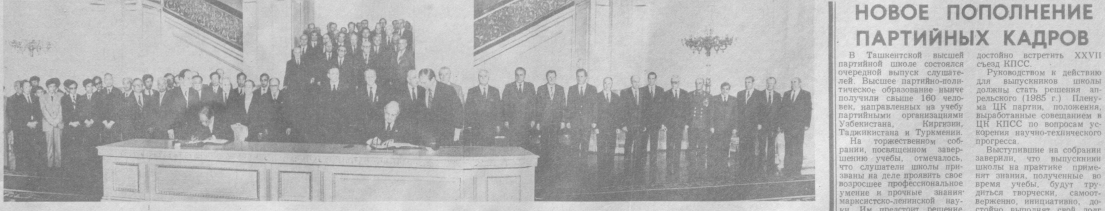
Во время подписания.

В нынешнем году народы наших стран, все прогрессивные люди планеты снова и снова обращают свои мысли к 40-летию Великой Победы над германским фашизмом и японским милитаризмом.