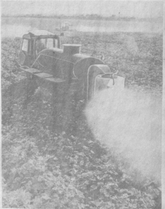
До полутора миллионов рублей сэкономит хозяйству Акылтинского района наземный способ дефолиации хлопчатника.

ХЛОПКОРЫ! Усилили напряжение на сборе урожая. Выше темпы и качество страды-85!