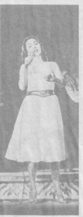
благодарить его организаторов. Праздник искусства удался на славу. Очень тепло принимали нас зрители. Рады мы и новой встрече с друзьями, общению с творческими коллективами...