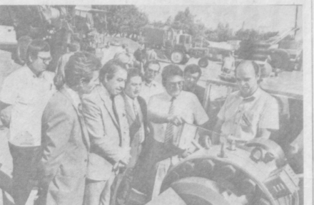
На ВДНХ Узбекской ССР работает международная выставка «Ирригация-85»...