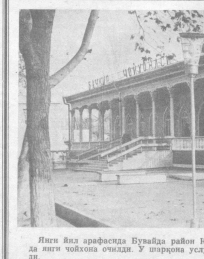
Янги йил арафасида Бугайда район Калинин номидаги қолхоз маркази Бачқир қишлоғида янги чойхона очилди.

Уғлимга мен кимнинг номини атай. Падаркушлар даври бўлди бу даврон, Диллар аламларга охларга тўлди,