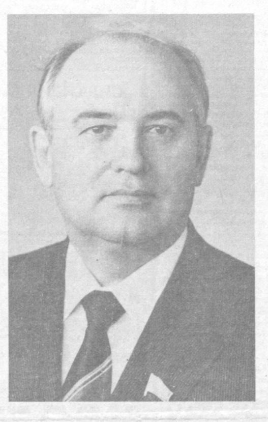
У. М. С. Горбачёвнинг таъиниқли омишати ва курулганини нишга конкрет ҳисса ўшишга даъват қилади. Унинг ўзaro боғлиқлиги ўгисидида фикр бутун илб мазмунига асос бўлган. Утган йилининг охирида талиянинг Ариольдо Мондори Эдиторе етакчи нашриёт трести босмадан чиқарган.

БАНГКОК. 22 декабрь. (ТАСС). «Совет раҳбарининг «Қайта қуриш ва янги фикрлаш мамлакатини ва бутун дунё учун» китоби бутун жаҳонда ҳақиқан равишда жуда катта қизиқиш уйғотди. Китоб кўп нускада ўнлаб мамлакатларда нашр этилди ва журналистларнинг фикрича «сиёсий китоблар орасида энг хариқдориги бўла олди». — деди бутун тайландлик таиниқли ношир ва нуфузли «Каописет» сиёсий журналининг редактори Чатчарин Чаяват. У М. С. Горбачёвнинг китобини тақдир этишқа бағишланиб бу ерда бўлиб ўтган тантанали маросимда сўзга чиқди. Китобни «Сампан Паблшинг компани» нашриёти босмадан чиқарган.